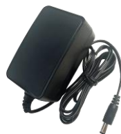
MSA-C1500IC12.0-18P-US MSA-C1500IC12.0-18P-GB MSA-C1500IC12.0-18P-JP Адаптер питания