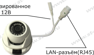
Рис. 1 Схема подключения видеокмеры